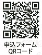
申込フォーム QRコード

※お申し込みが定員を超え、受講をお断りさせていただく場合のみ主催者からご連絡いたします。